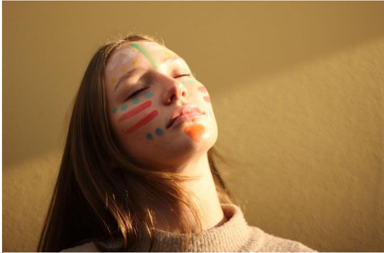
Slika 4: Primer poslikave obraza

starodavne sovražnosti ali pa za pridobitev surovin. Preden so se naučili konkretnega govorjenja so za sporazumevanje uporabljali okončine rok in pa obrazno mimiko, pri čemer so nezavedno vsaki črti na obrazu dali toliko pomena, da so se med seboj popolnoma razumeli. Ko so šli v vojno ali na lov so si na obraz nanesli simetričen ornament, ki je poudarjal namene. S pomočjo obraznih mišic je barva oživila in začela delovati po določenih pravilih. Severnoameriški Indijanci so z barvami ustvarjali vzorce na koži, ki so jim pomagali pri personifikaciji (Slika 3).