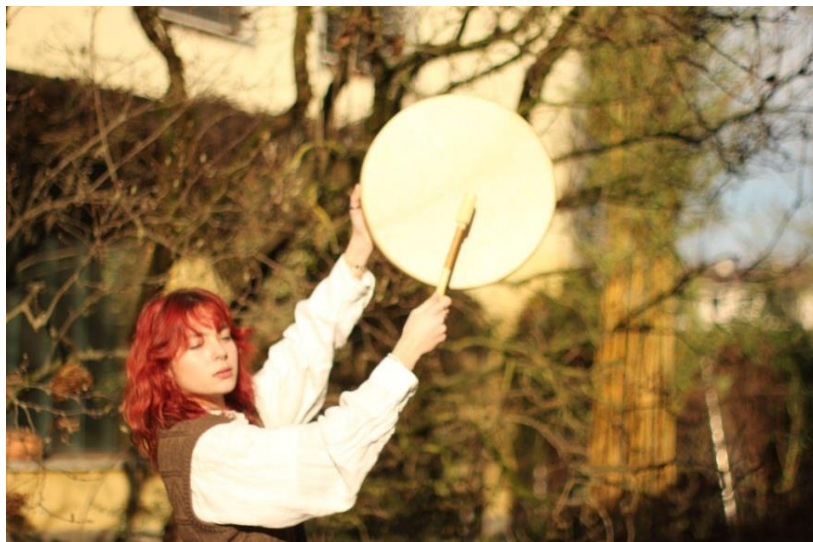
Slika 1: Šamanski boben

Sončni ples bo spremljal prijeten zvok šamanskega bobna. Uporablja se za potovanje v svet duš. Bobnarska palica je veslo za čoln, ki ustvarja utrip, ki povzroča trans in omogoča prehod iz enega sveta v drugega. Šamani po vsem svetu se zavedajo moči svetega bobna (Slika 1), da človeka pripelje iz tega kraljestva v drugo. Tako boben lahko uporabljamo tudi za zdravljenje ali ples.