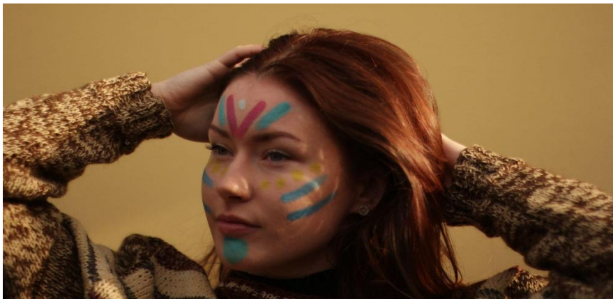
Slika 3: Primer poslikave obraza (Vir: Lasten)

barva je pomenila žalost. Modri ali zeleni vzorci so bili uporabljeni za najbolj intelektualno razvite in duhovno razsvetljenje člane plemena. Te barve so pomenile modrost in vzdržljivost.